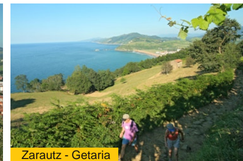
Zarautz - Getaria

kostako ibilbidean aurki daitezkeen artean ondoen kontserbatutakoen artean dago. Galtzada berehala urruntzen da hiri-inguruetik, eta Vista Alegre parkea inguratu ondoren, Zarauzko txakolin-mahasti zaharren artean jarraitzen du. Txakolina, izan ere, Zarautz eta Getaria artean hedatzen den lurraldeko nekazaritza-produktu nagusietako bat da. Txakolinaren ekoizpenari buruzko lehen erreferentziak Erdi Aroraino garamatzate, mahasgintza Gipuzkoako itsasbater osora hedatzen zen garaira, hain zuen. Txakolina inguruko biztanleen ohiko kontsumorako ekoizteaz gain, XVI. mendetik aurrera soberakinei beste erabilera bat ematen ere hasi ziren, baleak ehizatza eta bakailaoa arrantzatza Ternuko eta Artikoko itsasoetara joaten ziren arrantza-ontzien hornikuntzarako erabiltzen hasi baitziren. Edari honen berezitasunen artean, aipagarria da marinelen artean eskorbutoa saihesteko zuen gaitasuna. Halere, denborarekin, txakolinaren ekoizpen-eremua murrizten joan zen pixkanaka, eta, XX. menderako, itsasertzeko sektore txiki batek baino ez zuen jarraitzen edari honen laborantzan eta ekoizpenean. Zorionez, txakolinaren ekoizpena berriro indartu da gaur egun, eta produktuaren kalitatean oinarritutako hedapen-fase berri bati ekin dio.